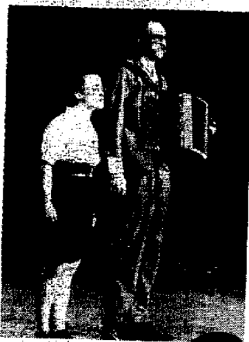
■ Un couple atypique au talent indiscutable.

Pratique Infos MJC École de cirque de Lyon - 29 avenue de Ménival Lyon 5 e Contact au 04 72 38 81 61 contact@ecoledecirque- de Lyon.com www.ecoledecirque- de Lyon.com Cie « Les Güns » Lauréats du prix du public MIM'OFF 2014